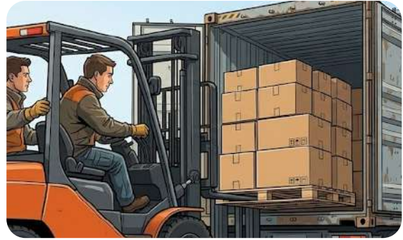
매주 자체 Consolidation 진행