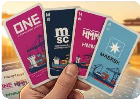
맞춤 스케줄 제공 다양한 선사와의 제휴 서비스를 통한 스케줄 제공